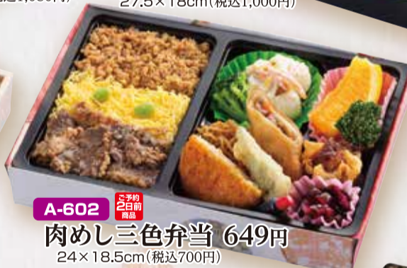
A-602 肉めし三色弁当 649円 24×18.5cm(税込700円)