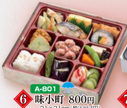
A-801 6 味小町 800円 21×21cm(税込864円)