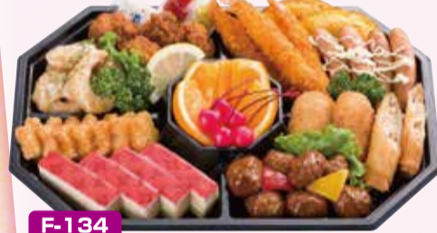
F-134 E/お子様向けオードブル 36×24cm