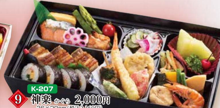
K-207 9 神楽 から 2,000円 36×20cm(税込2,160円)