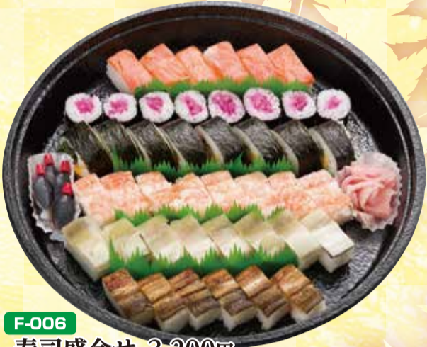
F-006 寿司盛合せ 3,200円 直径35cm(5~7名盛) (税込3,456円)