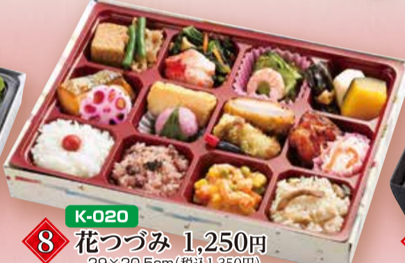
K-020 8 花つづみ 1,250円 29×20.5cm(税込1,350円)