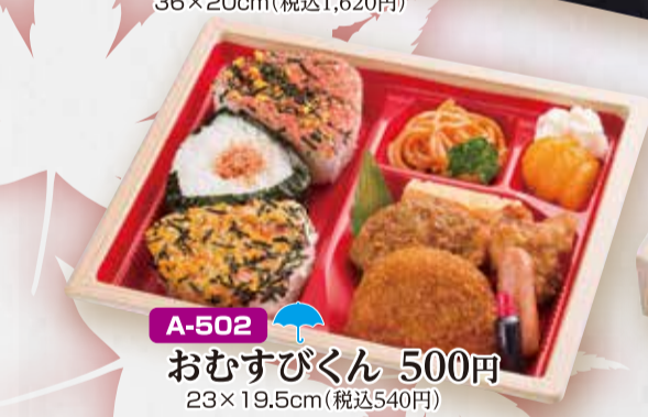
A-502 おむすびくん 500円 23×19.5cm(税込540円)