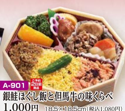
A-901 銀鯉ほぐし飯と但馬牛の味くらべ 1,000円 18.5×18.5cm(税込1,080円)