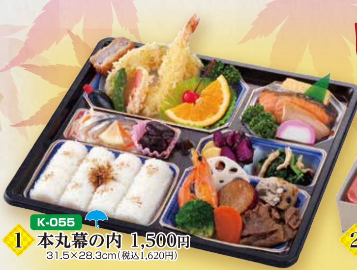
K-055 1 本丸幕の内 1,500円 31.5×28.3cm(税込1,620円)