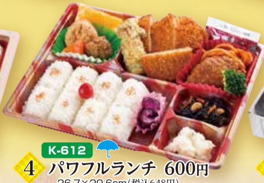
K-612 4 パワフルランチ 600円 26.7×20.6cm(税込648円)