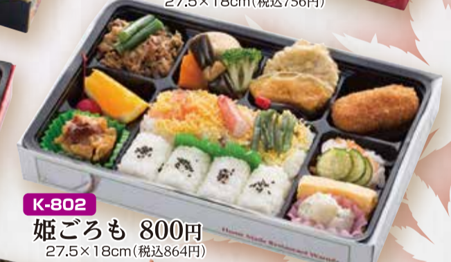
K-802 姫ごろも 800円 27.5×18cm(税込864円)