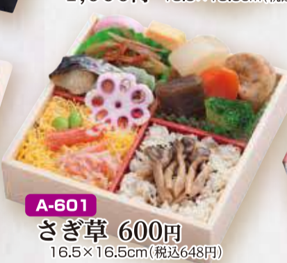
A-601 さぎ草 600円 16.5×16.5cm(税込648円)