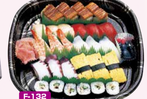
F-132 C/にぎり寿司 32×32cm