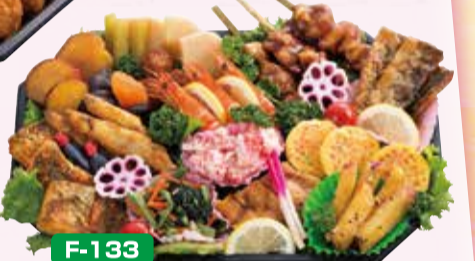
F-133 D/和風オードブル 36×24cm