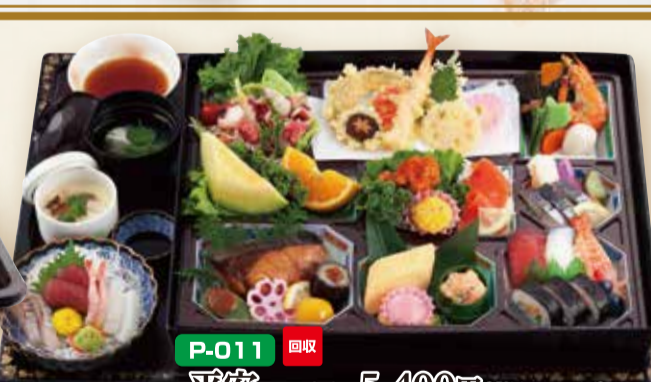
P-011 平安 へいあん 5,400円(税込5,832円) [本体]45×38cm [膳]61.5×45cm ※お料理本体のみでも承ります。