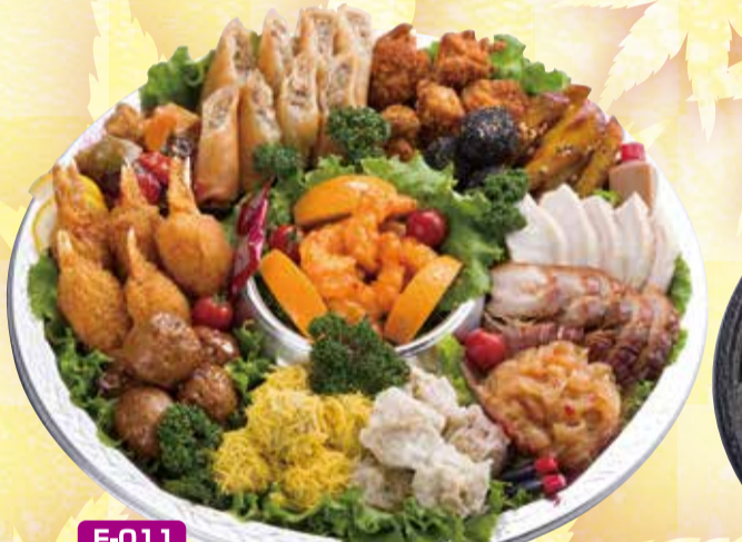
F-011 中華オードブル 6,500円 直径40cm(5~7名盛) (税込7,020円)

いずれも1皿(3~4名様用)3,500円(税込3,780円)が お得な3皿セット 10,000円(税込10,800円)