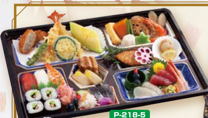
P-218-5 萩 はぎ 4,000円(税込4,320円) 43.5×32.6cm※お持帰り用袋付