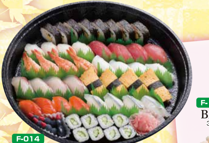
F-014 にぎり寿司 5,000円 直径39.5cm(5~7名盛) (税込5,400円)