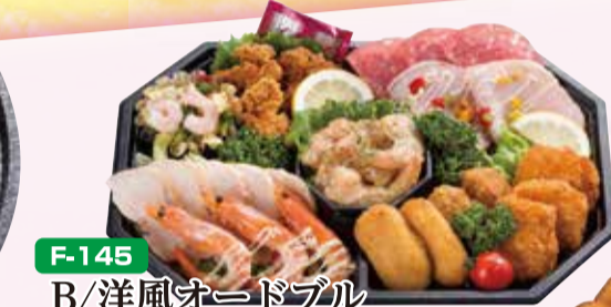
F-145 B/洋風オードブル 36×24cm