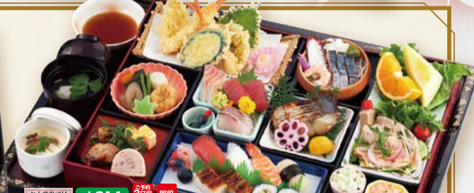
J-014 祇園 ぎおん 5,700円(税込6,156円) [本体]50×37cm [膳]61.5×45cm