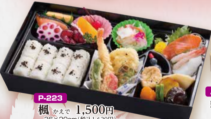
P-223 楓 かえで 1,500円 36×20cm(税込1,620円)