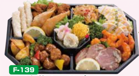
F-139 H/中華オードブル 36×24cm