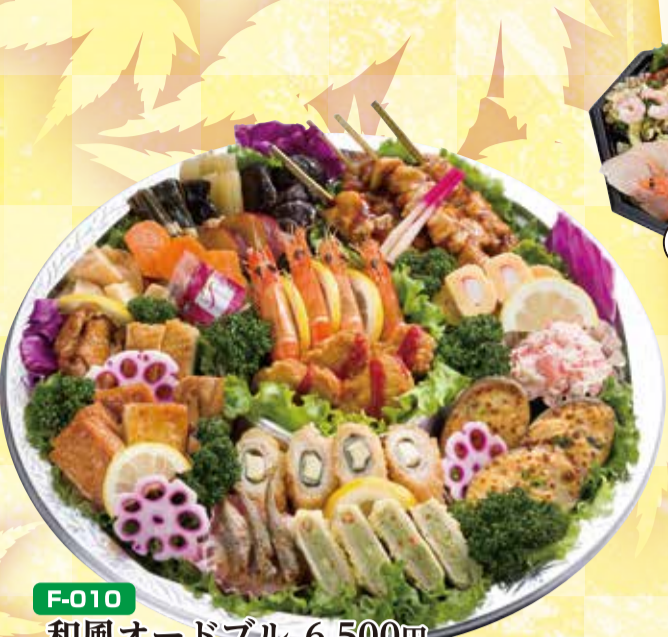
F-010 和風オードブル 6,500円 直径40cm(5~7名盛) (税込7,020円)