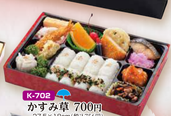
K-702 かすみ草 700円 27.5×18cm(税込756円)