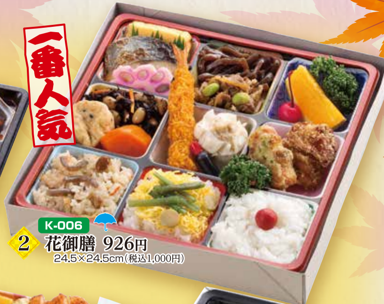
K-006 2 花御膳 926円 24.5×24.5cm(税込1,000円)