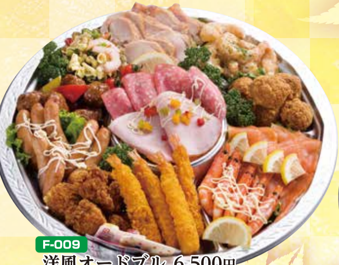
F-009 洋風オードブル 6,500円 直径40cm(5~7名盛) (税込7,020円)

下記日程は、ご利用いただけるお品が限られます。ご予約が大変集中いたしますので、ご理解頂きますようお願いいたします。 10月12日(土)・13日(日)・14日(月)・15日(火)・20日(日) は ○-○○○ (緑色枠)の番号からお選びください。