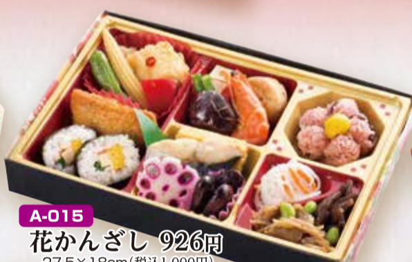
A-015 花かんざし 926円 27.5×18cm(税込1,000円)