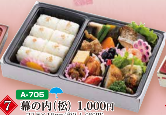
A-705 7 幕の内(松) 1,000円 27.5×18cm(税込1,080円)