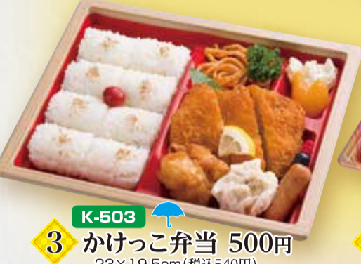
K-503 3 かけっこ弁当 500円 23×19.5cm(税込540円)