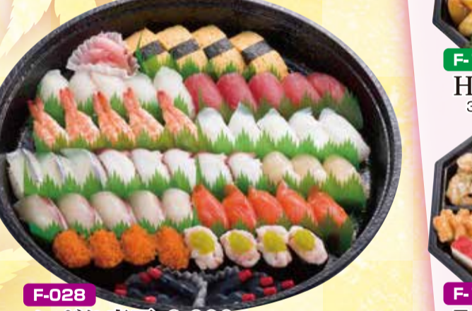
F-028 にぎり寿司 8,000円 直径39.5cm(5~7名盛) (税込8,640円)

J-080 食い初め膳 3,612円 26×26cm(税込3,900円) お箸とお箸入れは記念に御進呈致します。