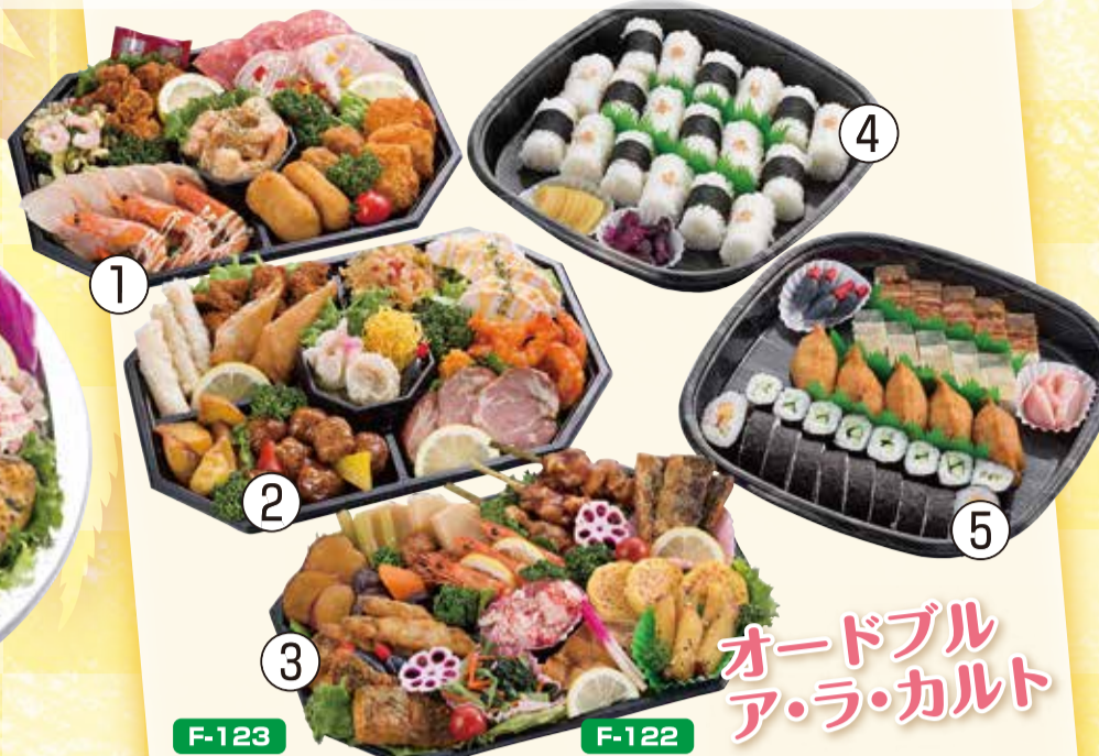
F-123 和・洋・中セット ①・②・③ 10,000円(約8~10名様分) (税込10,800円)