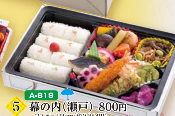
A-819 5 幕の内(瀬戸) 800円 27.5×18cm(税込864円)